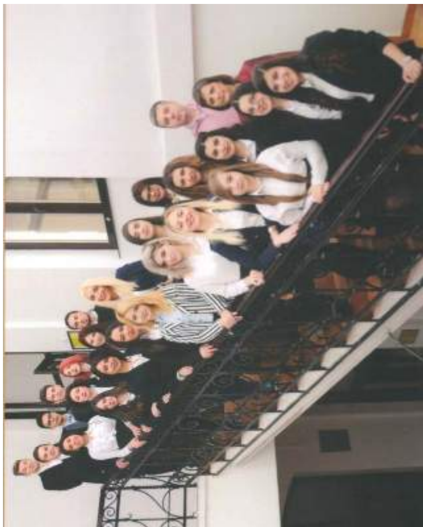
Clasa a XII-a C