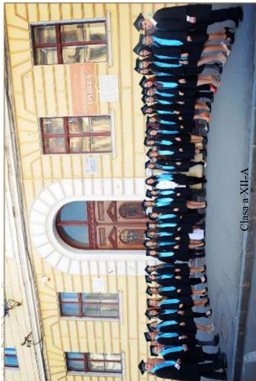
Clasa a XII-A