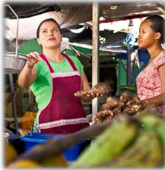
Piață din orașul Belize