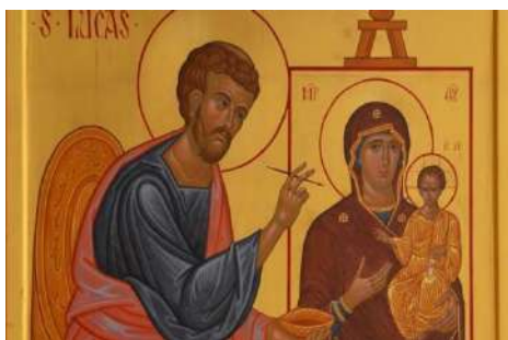
Sfântul Apostol și Evanghelist Luca