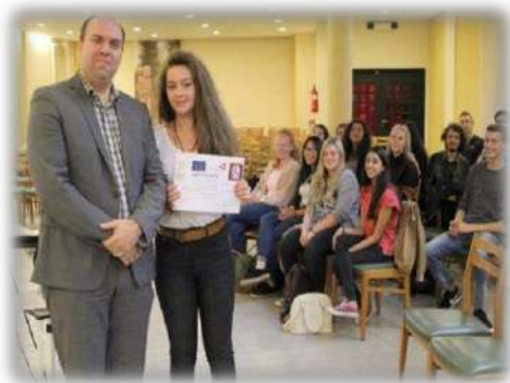
Întâlnirea cu reprezentantul PPE