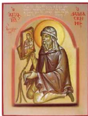
Sf. Ioan Damaschinul

Astfel, figurile emblematice ale anului omagial al sfințelor icoane, al iconarilor și al pictorilor bisericești sunt: Sfântul Apostol și Evanghelist Luca, Sfântul Ioan Damaschin și Sfântul Teodor Studitul. Sf. Ap. Luca a studiat filozofia, medicina și arta, el este considerat a fi fondatorul iconografiei creștine, primul care a pictat icoana Maicii Domnului Povățuitoarea sau „Arătătoarea drumului” - gr. Hodigitria, dar și icoane ale Sfinților Apostoli Petru și Pavel. Sfântul Ioan Damaschin (676- 4 decembrie 749), considerat ultimul părinte bisericesc, în ordine cronologică. Unul din cei mai importanți gânditori ai Bizanțului, de origine aramaică-siriană. Spirit enciclopedic, a încercat să realizeze o sinteză de vaste proporții, a întregii cunoașteri a epocii sale, în spirit creștin, proiectul său fiind comparabil, prin proporții, cu cel aristotelic. Are o operă bogată și variată. Conține tratate filosofice, dogmatice, polemice, exegetice, morale, ascetice, omiletice și imnologie. Sfântul Teodor Studitul (759-826) a fost un strălucit iconograf, teolog ortodox și stareț al Mănăstirii Sfântului Ioan Botezătorul de la Studion, în marginea orașului Constantinopol.