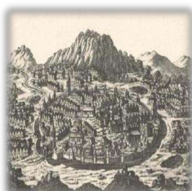
Brașovul în Evul Mediu