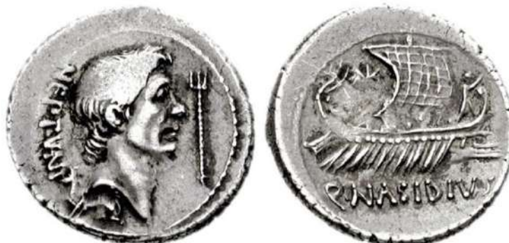
Sextus Pompeius, cel mai mare pirat al Antichității