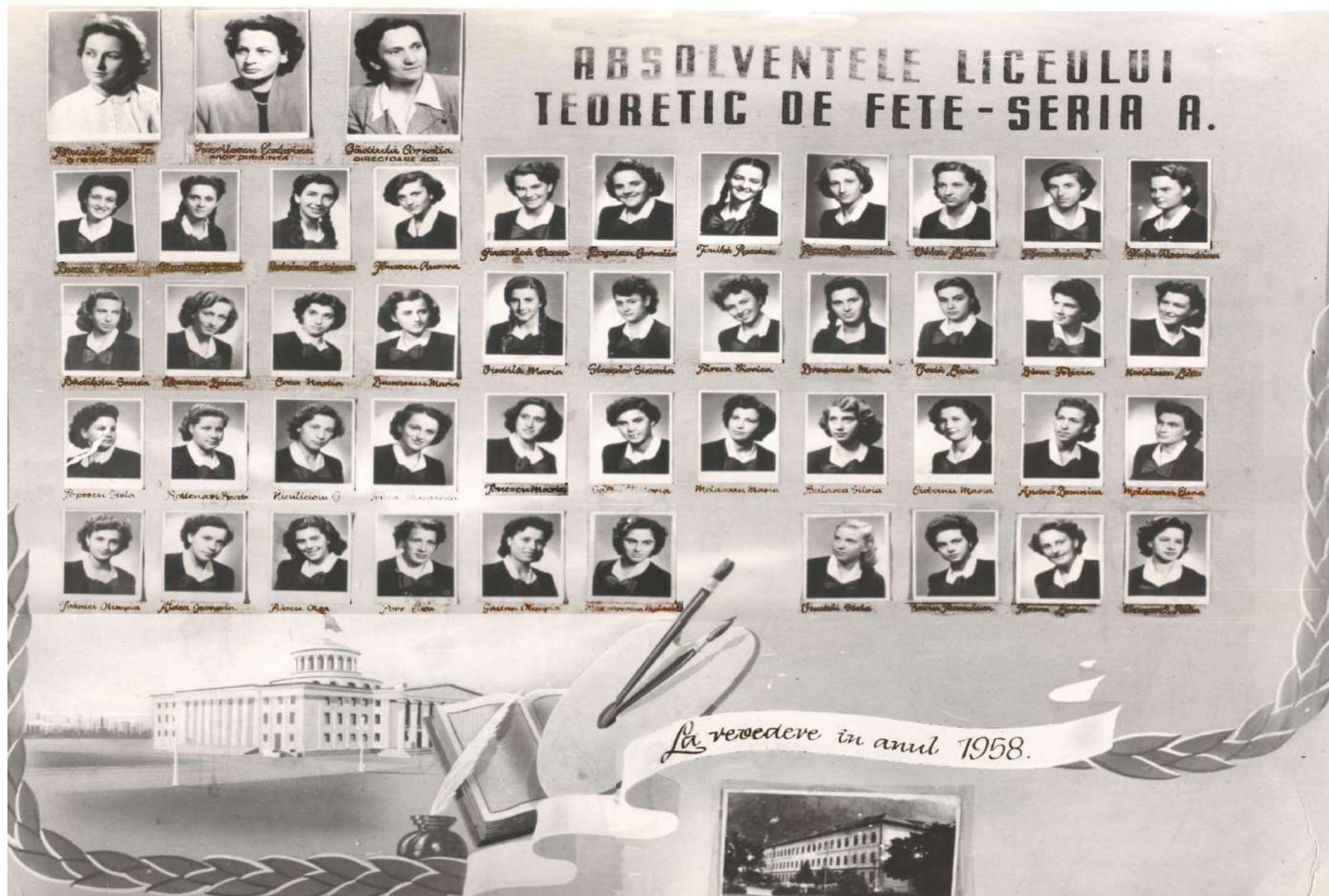
Absolventele Liceului Teoretic de Fete – 1958 – Seria A