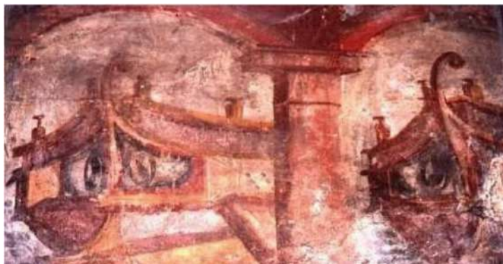
Pirați care au îngrozit Roma

Pirații cilicieni l-au trădat și pe Spartacus cu toate că îi promisese să treacă împreună cu răsculații săi în Sicilia în anul 72 d.Hr. .