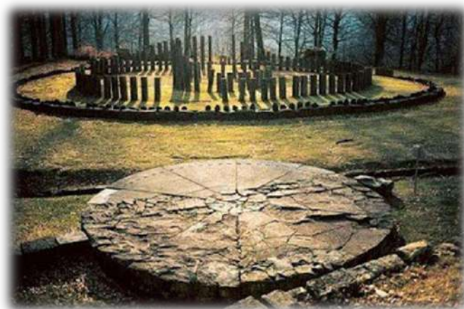
Sarmizegetusa Regia „Calendarul geto-dac”

Toți ar trebui să gospodărim timpul deoarece „ cine nu cunoaște prețul timpului nu este născut pentru mileniul III ”, am putea să-l parafrazăm pe Vauvenargues (1715 - 1747)